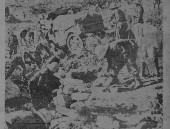
La tarea de conservar en estado de servicio las líneas de comunicación, tras del frente de batalla, es una de las más arduas a que tienen que hacer frente las tropas italianas que han invadido la Etiopía. Esta instantánea muestra los trabajos que pasan a destacadamente fatigosa en un lugar del trayecto de Adua y Mahale, para pasar un camión por una calzada provisional que se ha derrumbado a causa de las lluvias. Además los encargados de conservar las líneas de comunicaciones y aprovisionamiento, tienen que pelear a cada paso con las huerasillas abismales que los atacan cuando menos lo esperan y luego desaparecen en los montes.